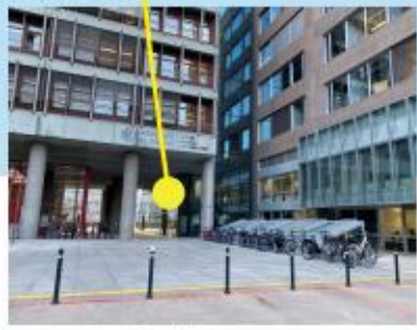
Entrée bâtiments A-B